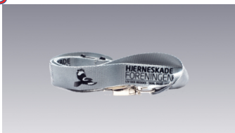
Keyhanger Pris kr. 65,-