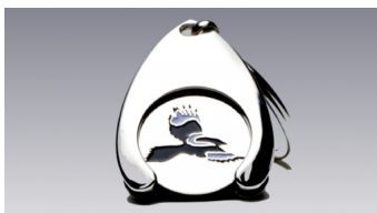
Vognmønt Pris kr. 70,-