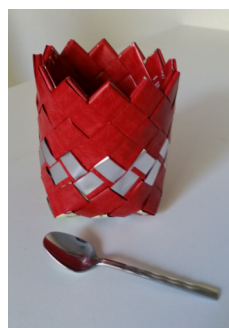
Lysesstage Pris kr. 40,-