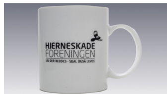
Krus med logo Pris kr. 65,-