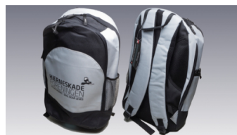
Rygsæk Pris kr. 150,-