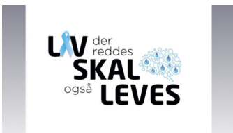
Postkort Pris kr. 0,-