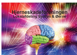
Musemätte Pris kr. 75,-