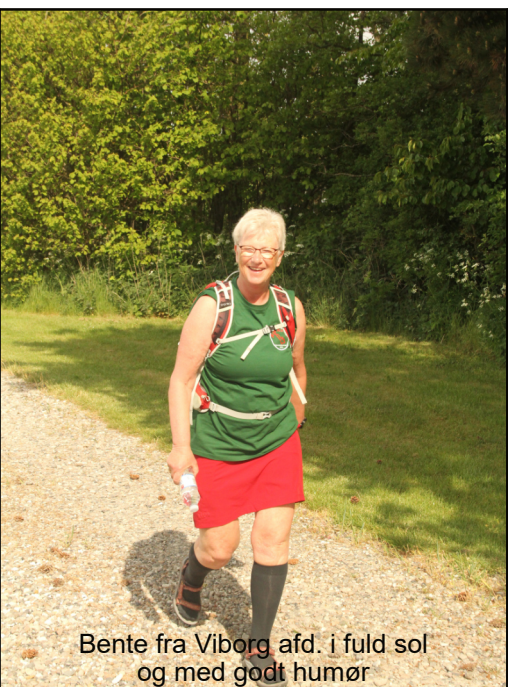
Bente fra Viborg afd. i fuld sol og med godt humør