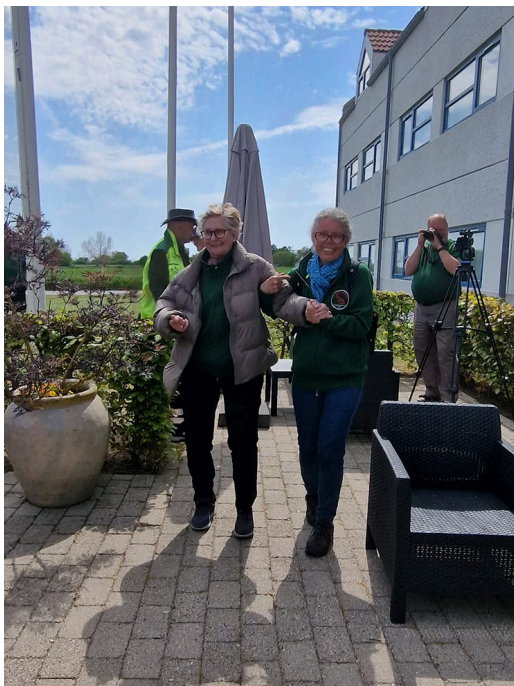
Glade og på vej i mål.