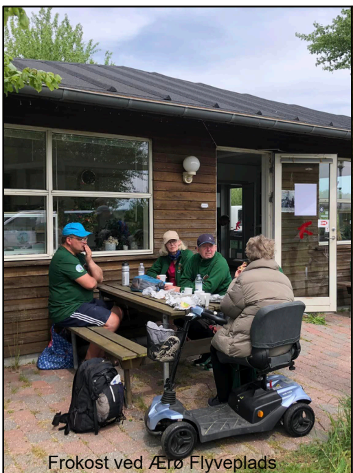
Frokost ved Ærø Flyveplads