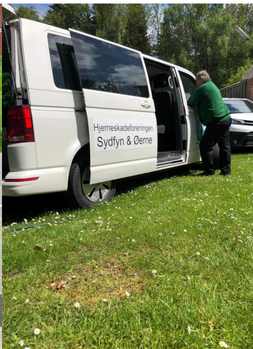
Møde ved følgebilen.