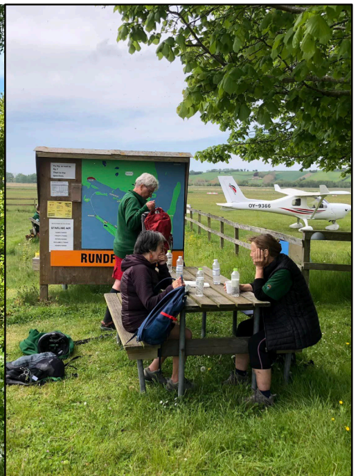
Frokost ved Ærø Flyveplads