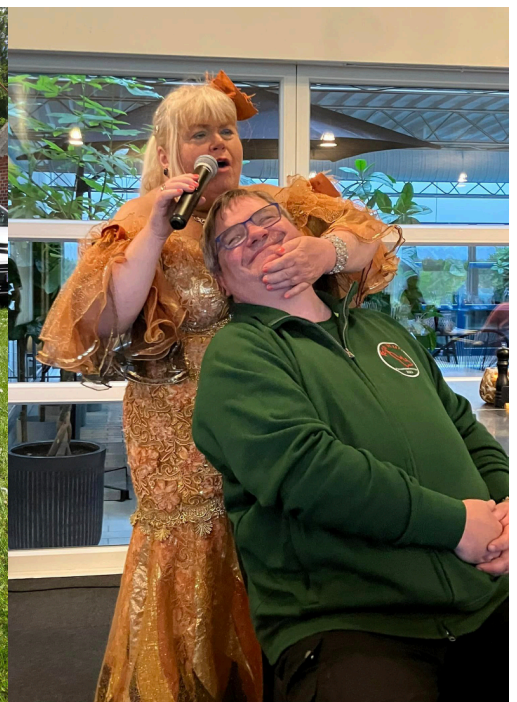
En meget glad mand, fra en aften med sang og musik.