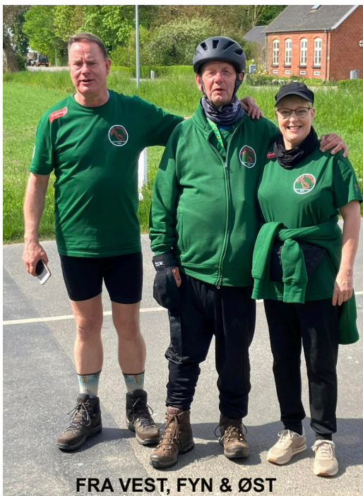
FRA VEST, FYN & ØST