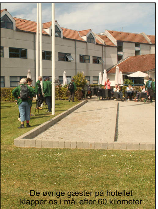
De øvrige gæster på hotellet klapper os i mål efter 60 kilometer